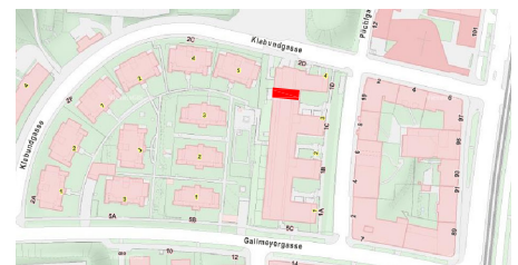
LAGEPLAN - genordet

Die in den Plänen vorhandenen Abmessungen sind nicht für die Bestellung von Einbaumöbeln verwendbar - Naturmaße nehmen erforderlich! Änderungen vorbehalten! Die Einrichtung ist illustrativ dargestellt, Ausstattung lt. gültiger BAB.