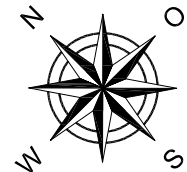
LAGEPLAN - genordet