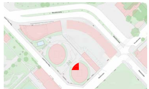
LAGEPLAN - genordet